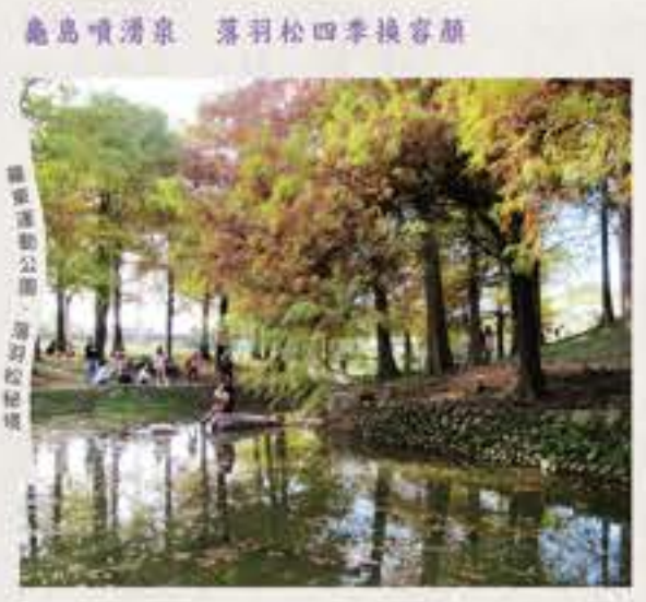
龜島噴湧泉 落羽松四季換容顏

北成線的水圳系統早期居民以「北門圳」稱之，後易名為「北成圳」，並與萬長春圳的灌溉系統連結。這條路線以羅東北成一帶的①北成龜島湧泉作為端點，從此處可見對田園水岸的風光，沿著水路於②興安宮旁同其他北成圳支線匯集，流經羅東運動公園；運動公園內的③紅明湖是觀察水鳥棲息生態的好去處，而流經公園的水圳，也養育④落羽松秘境景觀。