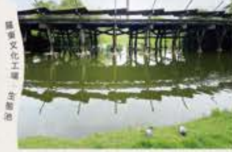
羅東文化工場 生態池

④羅東文化工場有水路流經，現今園區內的「高架跑道」生態池是羅東水文新風貌；文化工場旁的⑤南門路即是昔日南門圳加蓋後建成的道路，「南門港端午划龍舟」並非都市傳說，而是昔日老羅東的水路文化風情。