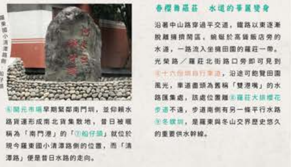
春櫻香羅莊 水道的華麗變身

④羅東文化工場有水路流經，現今園區內的「高架跑道」生態池是羅東水文新風貌；文化工場旁的⑤南門路即是昔日南門圳加蓋後建成的道路，「南門港端午划龍舟」並非都市傳說，而是昔日老羅東的水路文化風情。