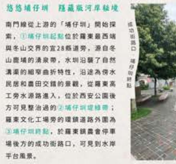
悠悠埔仔圳 隱藏版河岸綠境