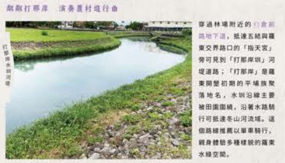
駁船打那岸 演奏農村進行曲

運動公園旁的河濱路23巷可見到⑤萬長春圳分水門，此分水門的兩路水道，北向水道為「二結圳」，水岸規畫⑥壹仔田園綠廊，是居民日常散步好去處；東向水道為流經竹林街的「竹林圳」，於環鎮道路旁的⑦松林公園和北成圳匯流繼續東流。此匯流水路與⑧動世堂為起點的竹義路重疊，於⑨林場（林業文化園區）北入口可見水邊風貌，而一旁即為有「⑩松羅圳」美名的貯水池，昔日因林業發展開闢的水池，如今成為兼具生態與遊憩的水岸地景。