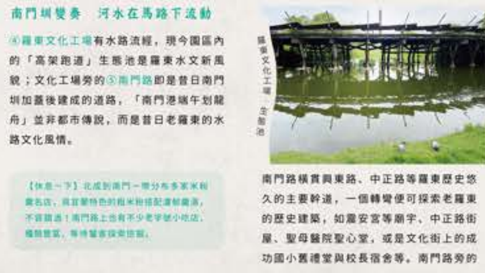
南門圳變奏 河水在馬路下流動

南門線從上游的「埔仔圳」開始探索，①埔仔圳起點位於羅東最西端與冬山交界的宜28縣道旁，源自冬山鹿埔的湧泉帶，水圳沿襲了自然溝渠的細窄曲折特性，沿途為傍水民居和農田交錯的景觀，從羅東高工旁水源路進入，位於西安公園後方可見整治過的②埔仔圳堤岸；羅東文化工場旁的環鎮道路外圍為③埔仔圳終點，於羅東鎮農會停車場後方的成功街路口，可見水岸平台風景。