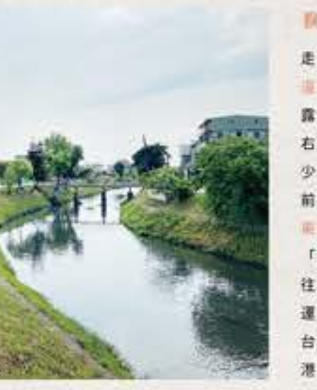
十六份圳自行車道

形成。月眉圳於中山公園東側沿著③東安街民居後方水路流出，於④羅東城隍廟後方的⑤東明巷可再度見到僅約200公尺的水路，亦可清楚看見月眉圳穿行城鎮聚落的水城路線和水道加蓋景觀。 【休息一下】中山公園有許多在地人喜愛的傳統戲水設施，「十份戲水亭」，一潭心，「花生橋」等設施與涼亭，遊客必將玩到停不了，最後也別忘記騎車。 觀遊型路線 順城人沿河岸而行 走出東明巷即接到羅東車站旁的⑥站前路平交道三角地，在馬路旁的時常綠地再次見到水路露面，接著繼續隱沒在柏油路下；穿過平交道右轉進入加蓋於水路之上的東安街，路上有不少早期矮房建築，穿行光榮路繼續沿著東安街前進，取而代之的是稻田景觀；路的盡頭是⑦東安橋遺蹟，坐在榕樹下長椅小憩可以遠眺到「十六份圳」河堤。沿著⑧十六份圳自行車道往郊區騎行，不僅能享受水岸綠意，還有早期運鹽歷史為概念搭設的「⑨雙港嘴」休憩平台，繼續前行在水松綠岸盡頭即見到舊稱「雙港嘴」的水路匯流處。