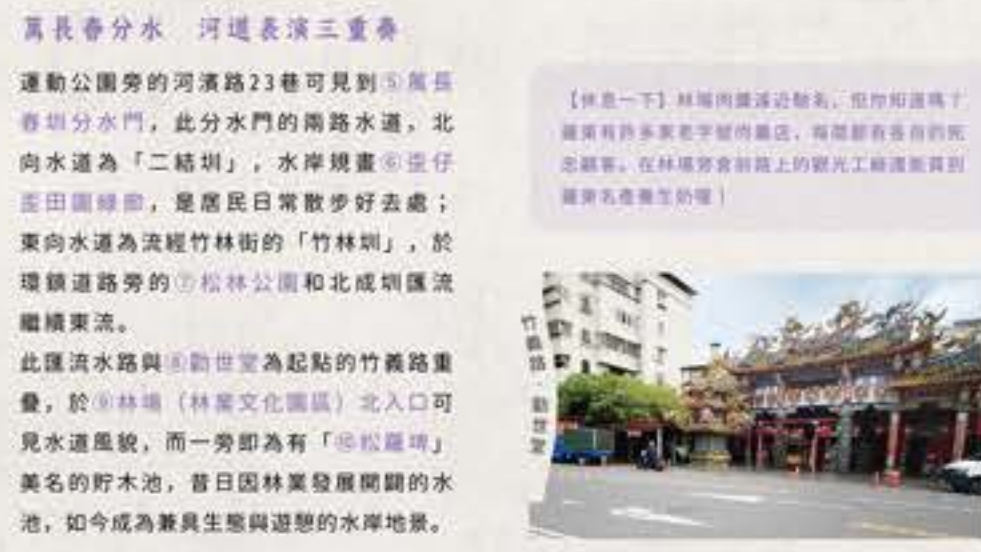
萬長春分水 河道表演三重奏

北成線的水圳系統早期居民以「北門圳」稱之，後易名為「北成圳」，並與萬長春圳的灌溉系統連結。這條路線以羅東北成一帶的①北成龜島湧泉作為端點，從此處可見對田園水岸的風光，沿著水路於②興安宮旁同其他北成圳支線匯集，流經羅東運動公園；運動公園內的③紅明湖是觀察水鳥棲息生態的好去處，而流經公園的水圳，也養育④落羽松秘境景觀。